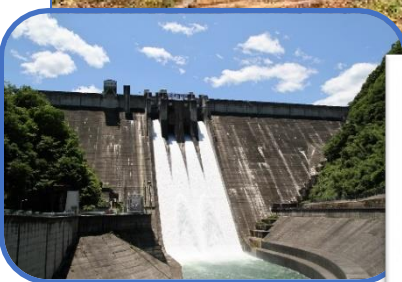
下久保ダム(藤岡市)