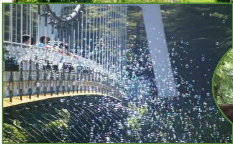
スカイブリッジ(上野村)