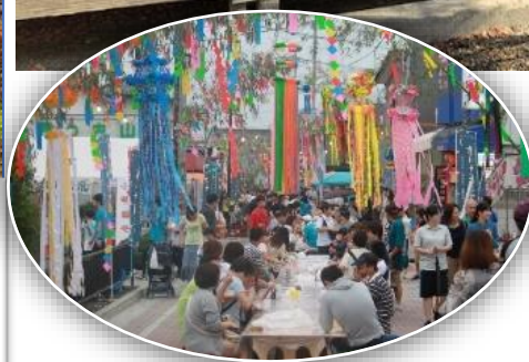
七夕まつり(高崎市新町)