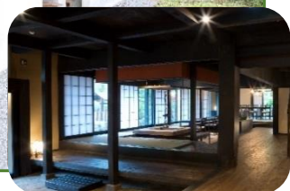
古民家の宿(神流町)