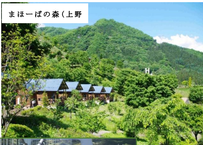
まほーばの森(上野)