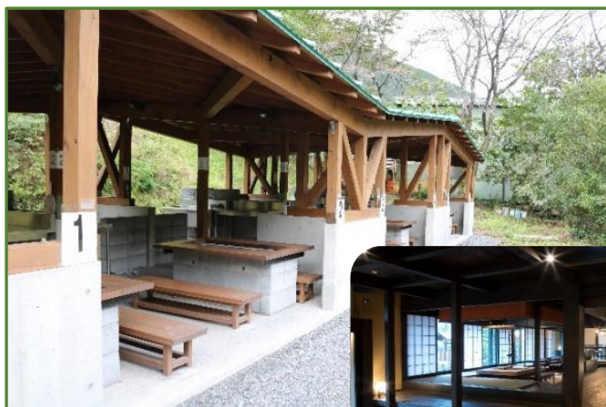
はこだたみキャンプ場(神流町)