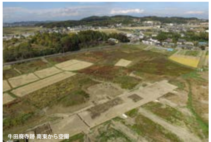
牛田廃寺跡 南東から空撮