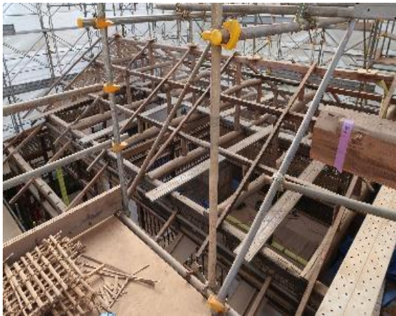
修復工事中の母屋兼蚕室