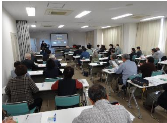
人権教育推進事業 (人権啓発指導養成講座)