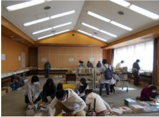
令和3年11月7日(日) 古本市