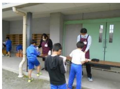
巡回文庫の様子(小野小学校)