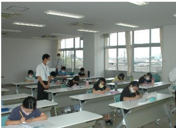
青少年センター運営事業 (夏休み学習支援事業)