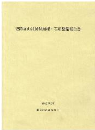
刊行した「史跡高山社跡付属棟・石垣整備報告書」