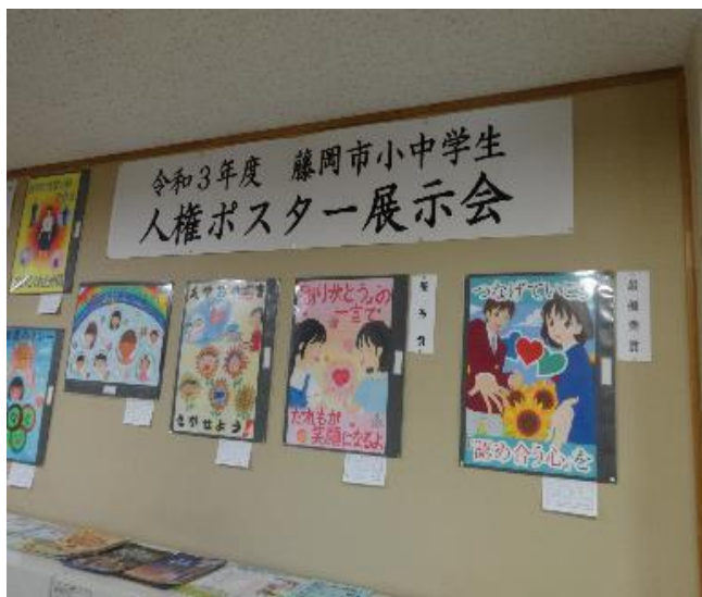
人権教育推進事業 (人権ポスター入選作展示)