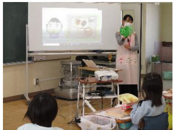
動画を用いて行った給食時学校訪問