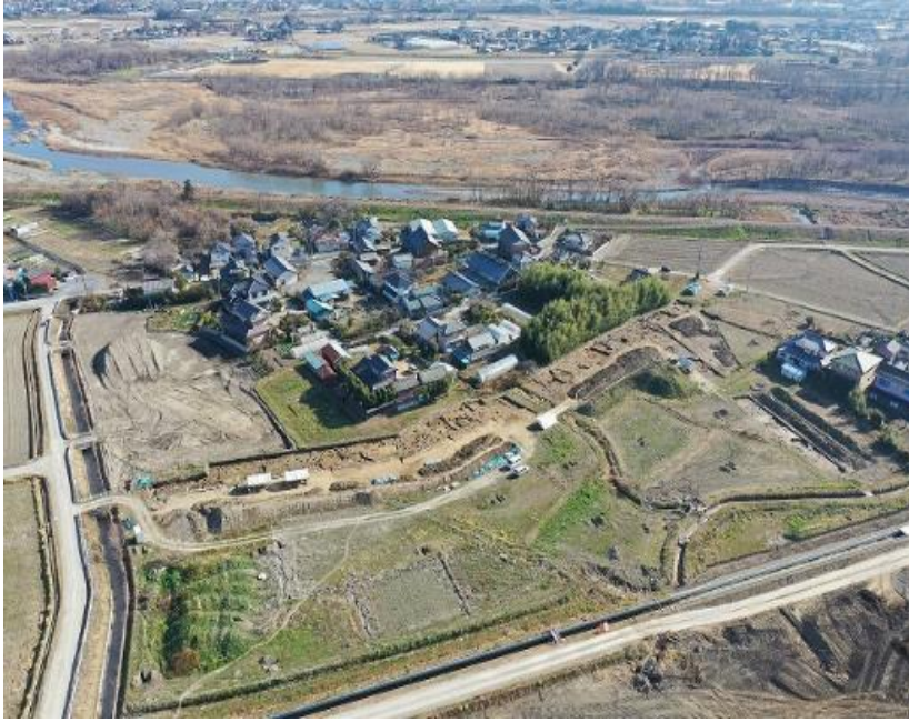
牛田・川除地区遺跡群発掘調査(空撮)