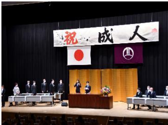
成人祝式典事業 (成人式)

○今年度は、「少年の主張藤岡市大会」が実施されている。「街頭歩道やパトロール」については、実施回数が増加しており心強い。成人式も挙行政も、昨年度より出席率が増加している。新型コロナウイルス感染拡大の影響は、まだまだ残るが、引き続き「おぜのかみさま」運動、パトロール、「居場所づくり」などの活動を通じて、青少年の健全育成の推進をお願いしたい。