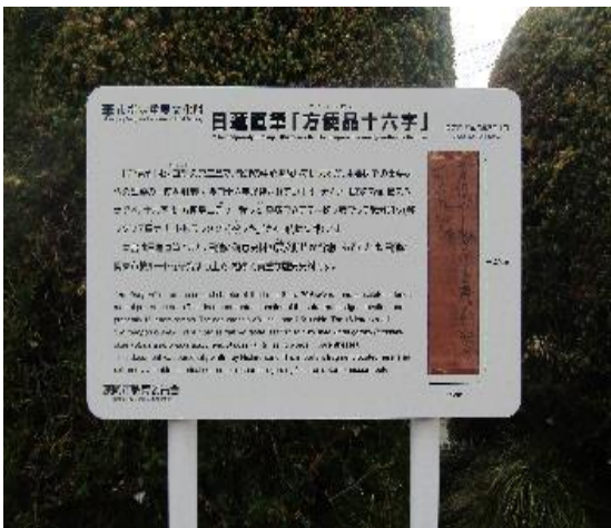
「日蓮直筆方便語」の説明板