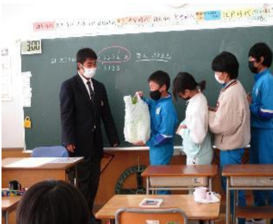
藤岡北高校生徒の学校訪問