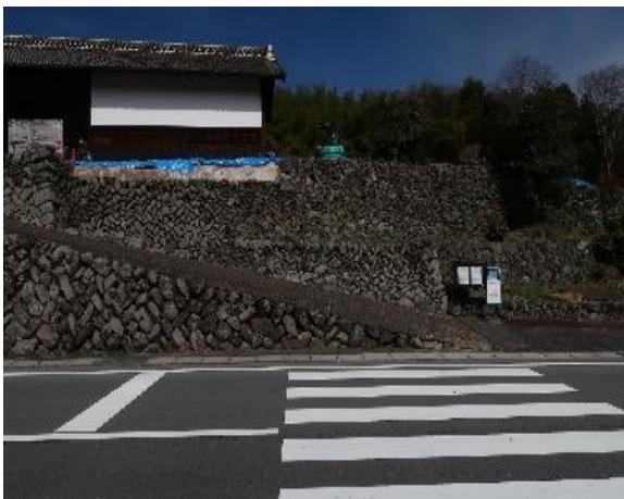
修復完了した石垣