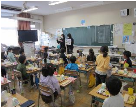
藤岡北高校生徒の学校訪問