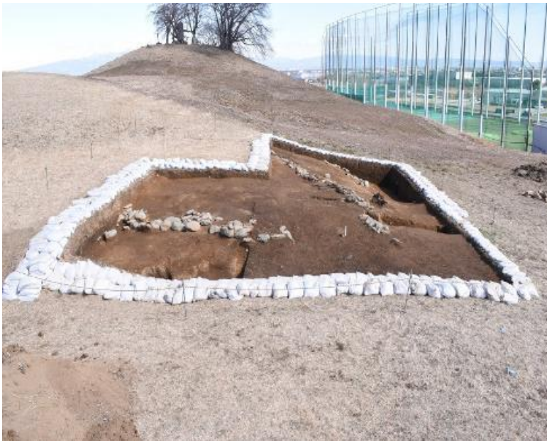
特定古墳調査 発掘調査写真