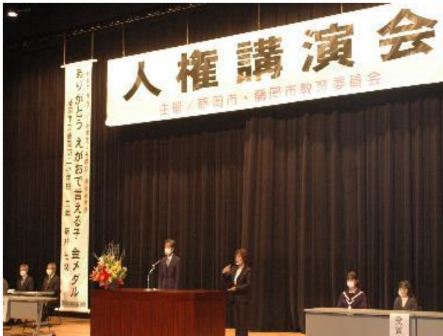
人権教育推進事業 (人権講演会)