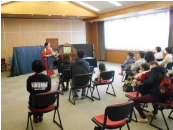
令和4年3月19日(土) 遊びの学校「紙芝居の出前公演」