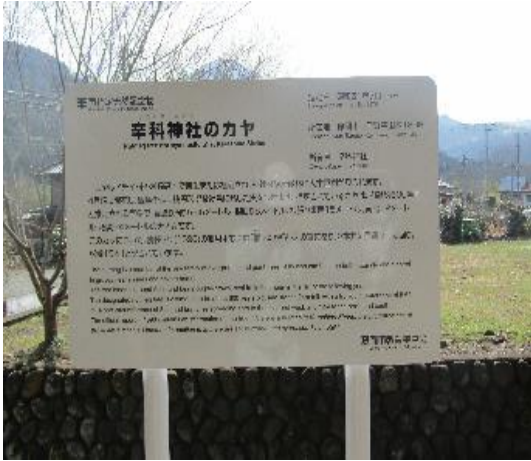
「辛科神社のカヤ」の説明板・標柱