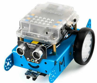
車型トイ・ロボット