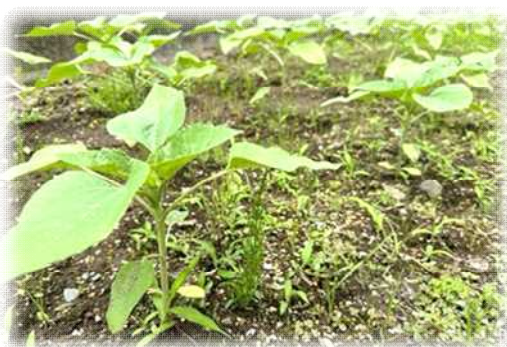
6月24日（土）のひまわりの様子

地域づくりセンター日野では、市制施行70周年 関連事業「ひまわりでつなぐ市民の絆活動」の一環 として、ゴールデンウィーク明けに種をまき、ひま わりを大切に育てています。