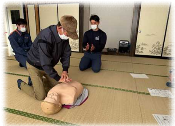
心肺蘇生法の講習