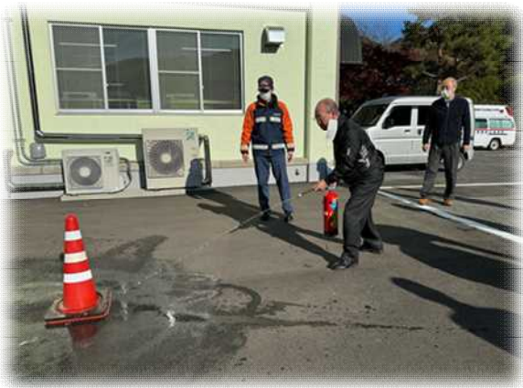
水消火器を用いた消火訓練

また、地域づくりセンター日野の階段の踊り場には、日野小学校の児童が作成した日野地区にある AED の場所をまとめたマップが掲示されています。AED を使わないに越したことはないですが、いざというときに困らないよう自宅周辺の AED の設置場所について、是非ご確認をお願いいたします！！