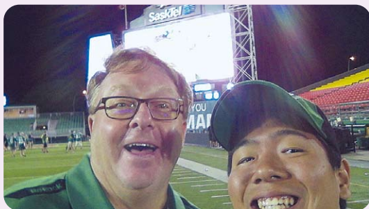
ホストファザーとのフットボール観戦

先輩の一言から始まった私の海外との繋がりは、10年たった今でもなお続いて成長しています。これまでの思い出とこれから起こるだろう沢山の楽しい出来事を楽しみにしながら、積極的に交流を続けていけたらと思っています。