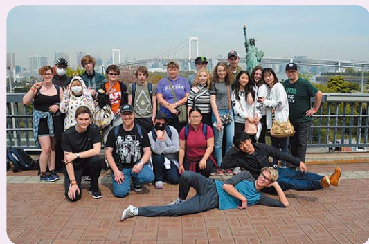
日本語教室の生徒たちと

藤岡市国際交流協会事務局（藤岡市役所自治交流課） 〒375-8601 群馬県藤岡市中栗須327 TEL 0274-40-2428（直通） FAX 0274-24-3252 URL = http://www.city.fujioka.gunma.jp/kakuka/f_jiti/fia_top.html e-mail = fia@city.fujioka.gunma.jp