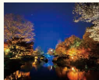
桜山公園ライトアップ