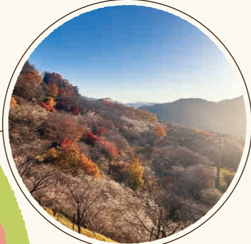
桜山公園から御荷鉾山を望む