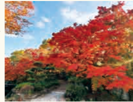
紅葉 10月中旬～12月上旬