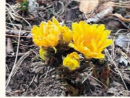
福寿草 2月中旬～3月中旬