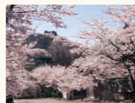
ソメイヨシノ 4月上旬～中旬