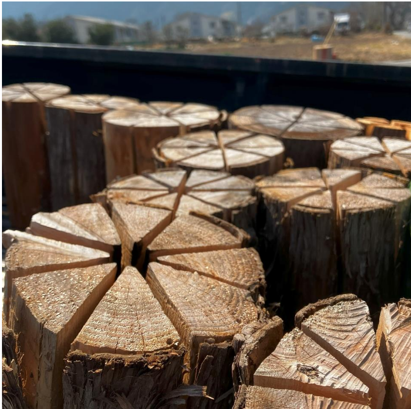
▶鬼石朝市で販売したスウェーデントーチ。 市内の間伐材を利用している。