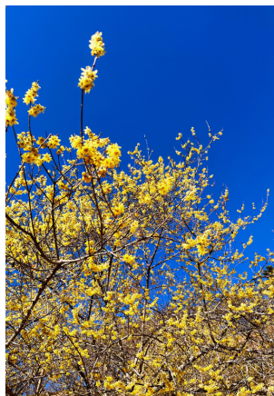
↑2月中旬頃まで見頃予定