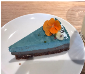
↑栄養たっぷりローケーキ

鬼石での開業に向けてシェアカフェに挑戦してみたい？とお話をいただいたから一ヶ月。メニューを決めて、手配して、当日の流れを考えて：怒涛のように過ぎていきました。娘もまだまだ目が離せない年齢なので、私一人では出来ないことが山のようにあり、たくさんの方に頼って、お願いして、助けてもらって：という日々を過ごしました。感謝が絶えません。力やお知恵を貸して下さいました方々と、当日ご来店いただいた皆様、美味しいと言って下さった皆様に心から感謝申し上げます！