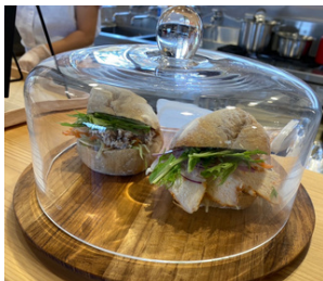
↑天然酵母の全粒粉パンでサンドイッチ