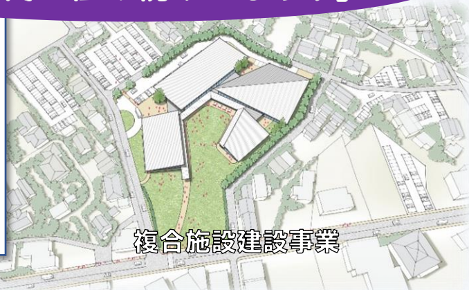
複合施設建設事業