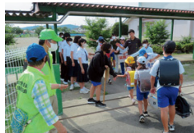
スマイル・ハイタッチあいさつ運動

平井小学校を輝く笑顔でいっぱいにするために、児童会本部は、月に1回、西中学校の生徒と一緒に校門であいさつ運動を行っています。地域の民生委員・児童委員にも参加していただき、小学生と中学生、地域が一体となって、「笑顔であいさつ」「スマイル・ハイタッチ」で児童を迎えています。児童もとびきりの笑顔で「おはようございます」とあいさつを