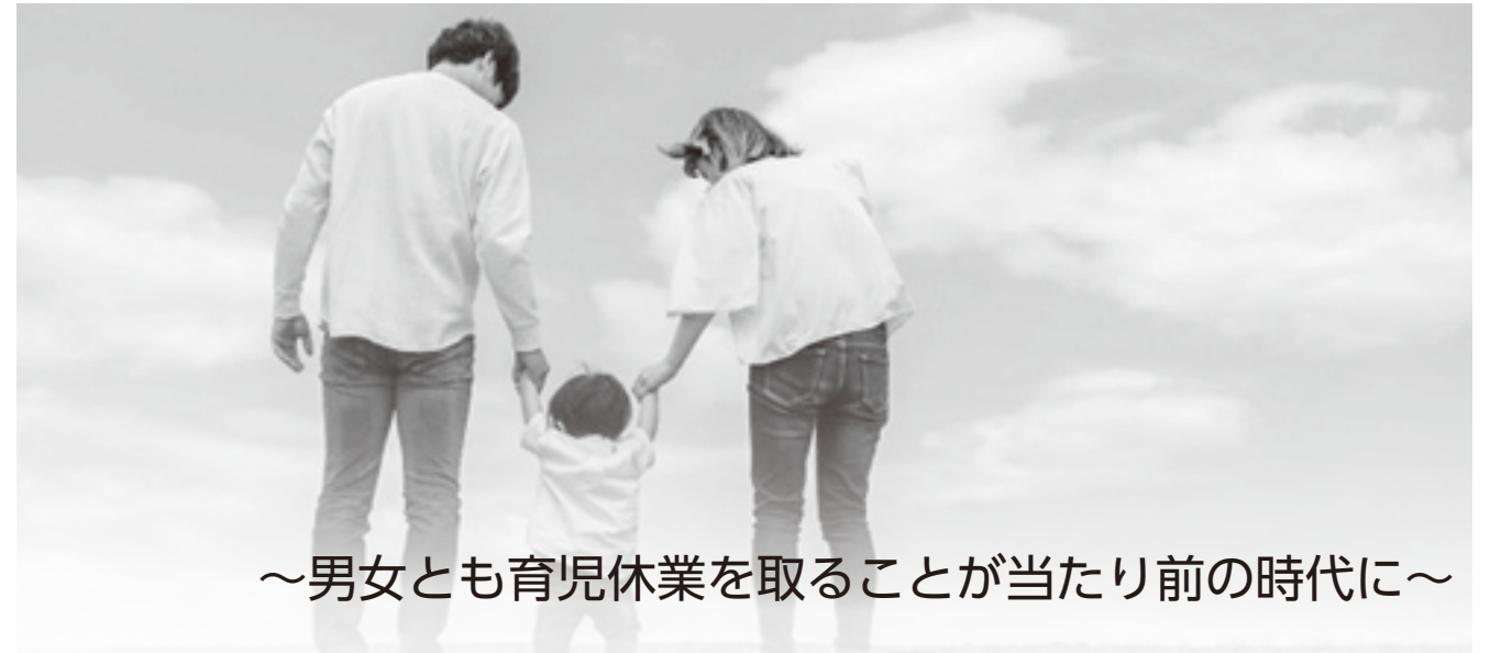
～男女とも育児休業を取ることが当たり前の時代に～