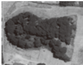
全長 150メートルの七興山古墳

市には、古墳時代に約1,500基の古墳が存在していたこともあり、県内でも多くの古墳がある地域です。特に国指定史跡「七興山古墳」は、墳丘が全長150メートルで6世紀築造の前方後円墳では国内3位の規模です。