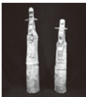
実物の大刀を精巧に模した平井1号大刀形埴輪

埴輪も数多く出土していることから、埴輪づくりの職人の村があり、大量生産していたと考えられています。技術力が高く、細部まで表現された多くの埴輪が見つかっています。