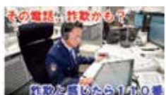
▲特殊詐欺被害防止編