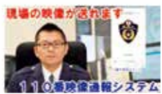
▲110番映像通報システム編