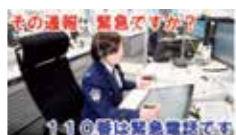
▲その110番、緊急ですか?編