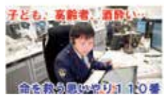
▲命を救う、思いやり110番編