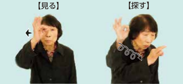
親指と人差し指で円を作り、目元から前へ出す 親指と人差し指で円を作り、目元で数回回す

手話は音声言語と異なり、手指や体の動き、表情を使って視覚的に表現する言語です。手話が身近な言語となるよう、皆さんもやってみましょう。 今月は「見る、探す」を紹介します。