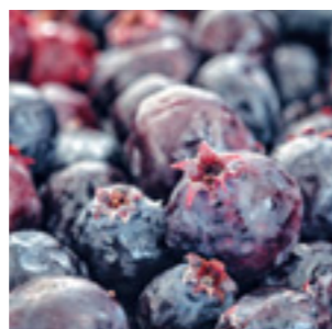
サスカトゥーンベリー

藤岡の皆さんも、リジャイナ市を訪れる際にはぜひお立ち寄りくださいね。お待ちしております！