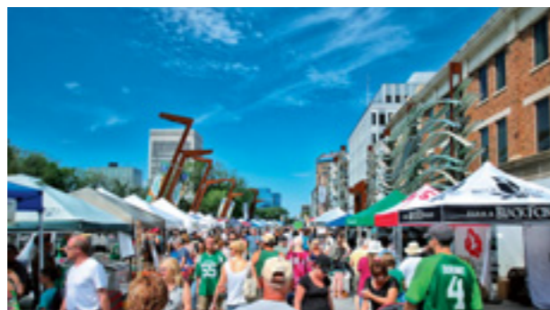
青空の下でにぎわうマーケット