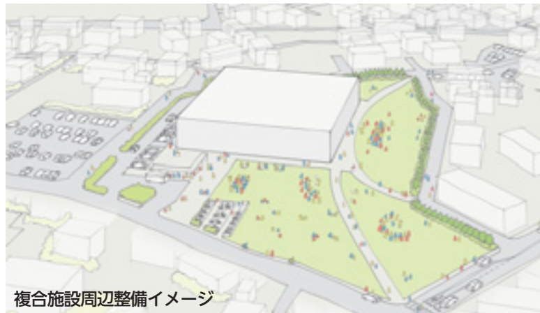
複合施設周辺整備イメージ