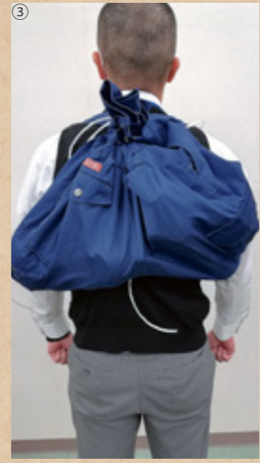
③長ズボンの両足部分をリュックサックの肩ベルトにして、背負うことができます。背負うことができますようになります。