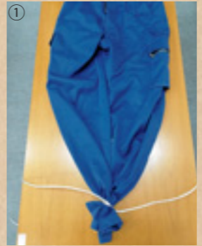
①ズボンの両裾を重ねて、ひもで結びます。結んだ後のひもは、両側が均等に残るようにします。

今回は、被災時や緊急時に使える長ズボンを使った簡易リュックサックの作り方を紹介します。いざという時に作れるように、一度試してみたいかがでしょうか。