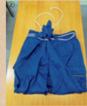
②長ズボンを膝の辺りで折り返し、ひもの残りの部分をベルト通しに一周させて通します。