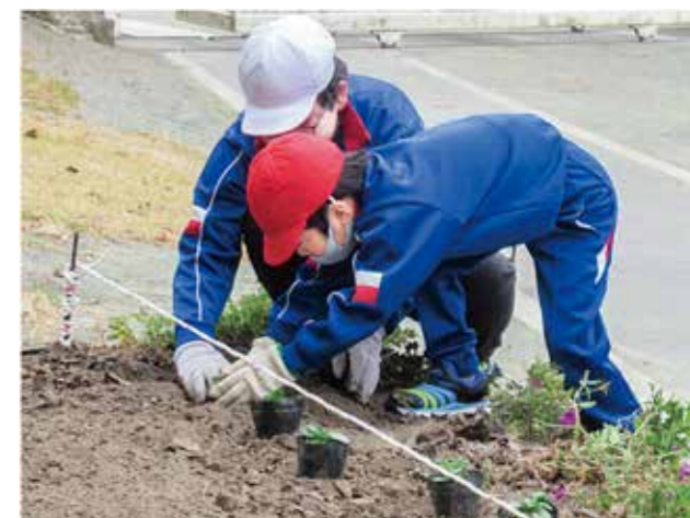
↑12月に行われたパンジーの定植。

日野小の春はサフィニアの植え付けから始まりです。今年4・5月は休校だったため、植え付けは職員が行いましたが、6月の学校再開後は水やりなど児童が丹念に面倒を見て、夏には校舎が淡いピンク色に染まりました。夏休みが目前に迫るころ、花