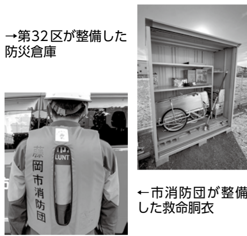
→第32区が整備した防災倉庫 ←市消防団が整備した救命胴衣

問い合わせ 地域安全課(☎27444) 問い合わせ 前橋地方裁判所(☎027・231・4275)