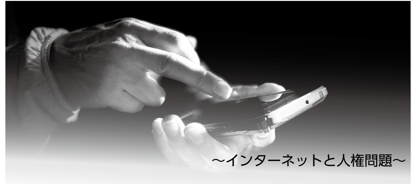
~インターネットと人権問題~

インターネットの利用が活発になり、感染症流行の中、子どもたちがオンライン授業を受けたり、大人がリモートによる仕事や研修、時には飲み会まで行ったりする姿が日常化しつつあります。 インターネットは上手に使用すれば便利なものですが、その特性から悪い影響を与えてしまうことも多く見られます。特に「匿名性」「拡散」という点から、人権侵害につながる問題が出てきています。