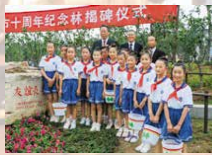
⑤サクラの苗木300本を江陰市内徐霞客公園内に植樹