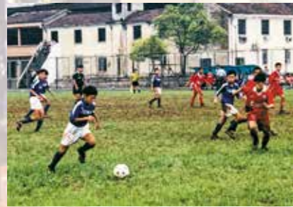
①サッカー代表団が江陰市で交流試合