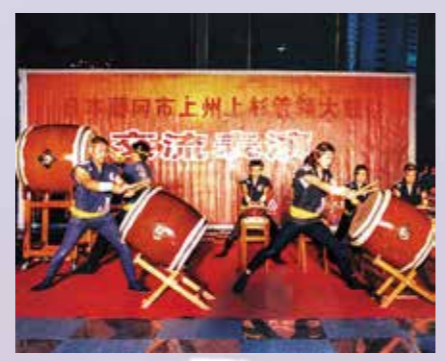
②江陰大橋の完成を祝う上州藤岡上杉管領太鼓による太鼓演奏

21年前に江陰大橋の完成を祝し、江 陰市の方々からの熱烈な歓迎の中で太鼓を 演奏したことは、今でも鮮明に覚えています。今後も多くの 人にエネルギーある中国を体感していただき、友好都市交流 が末永く続いていくことを切に願います。