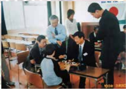
④藤岡ジュニア囲碁大会で江陰市囲碁交流訪問団による指導対局