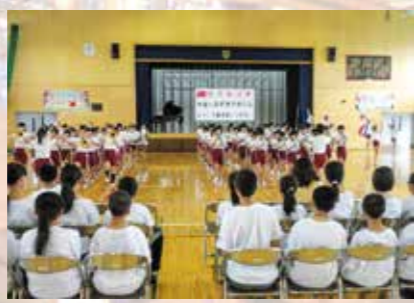
⑥来藤をマーチングと合唱で歓迎する藤岡第二小学校児童