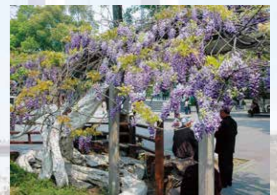
江陰市中山公園内「千年紫藤」

国・省 中国江蘇省 人口 約126万人 面積 987.5km 2 (藤岡市の 約5.5倍) 気候 年間平均気温16℃ 年間降水量 1,100mm 緯度 北緯31°