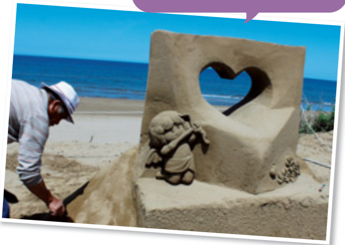
砂像協会による制作風景