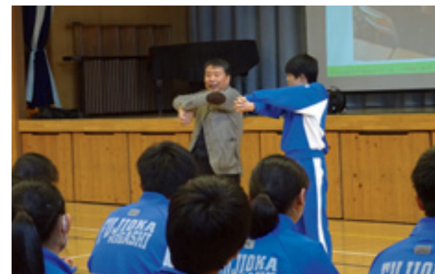
↑「みんながゲートキーパー講座」の様子。

また「相手への思いやりの心は、自分自身を大切にすることから始まる」という考えの下、前期には