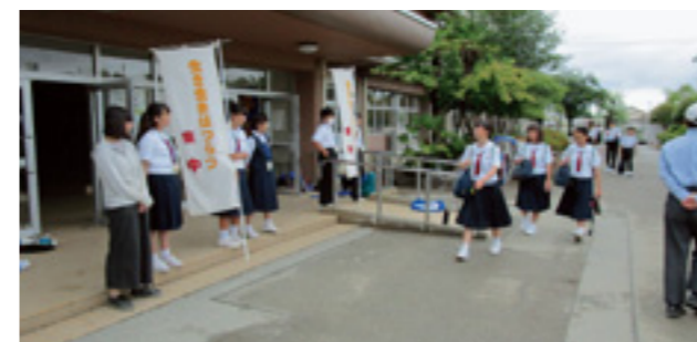
↑「地域でふれあう」あいさつ運動

今年度も人権教育をより一層充実させ、「慮る」心があふれ、生徒が安心して楽しく過ごすことのできる学校づくりをしていきます。