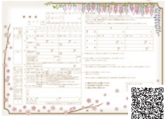
問い合わせ 企画課 ☎ 2424 市HP

利用方法 インターネットで「まちキュンご当地婚姻届」と検索し、専用サイトからダウンロードして利用してください ※ご当地婚姻届は窓口での配布はしていません。届け出に利用する際は必ずA3サイズに印刷してください