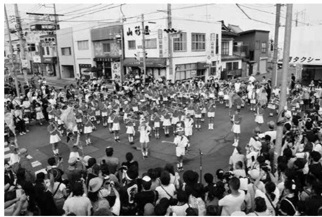
↑藤岡まつりでマーチングを披露。

藤岡まつりで行われるパレードでは、毎年6年生がマーチングを披露し、お祭りを盛り上げています。多くの市民の前で堂々と演奏する姿は下級生の憧れです。3学期になると5年生は、6年生からマーチングで学んだことを教えてもらい、第一小の伝統を引き継いでいきます。