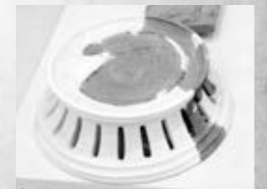
下日野金井窯跡群出土の円面硯

当時、文具を使用した人々は非常に少数ですが、官人や僧侶のような限られた人々には欠かせない道具でした。円面硯は本市では上栗須寺前遺跡、株木遺跡、下日野金井窯跡群で出土しています。古代の藤岡地域でも一部の人々の間では円面硯が使われたよう