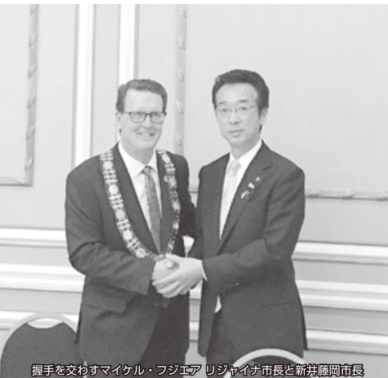
握手を交わすマイケル・フジエア リジャイナ市長と新井藤岡市長