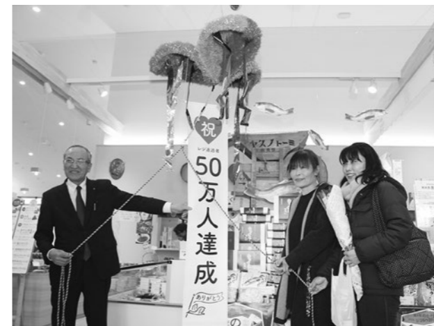
↑レジ通過者50万人を達成して盛り上がる道の駅のと千里浜