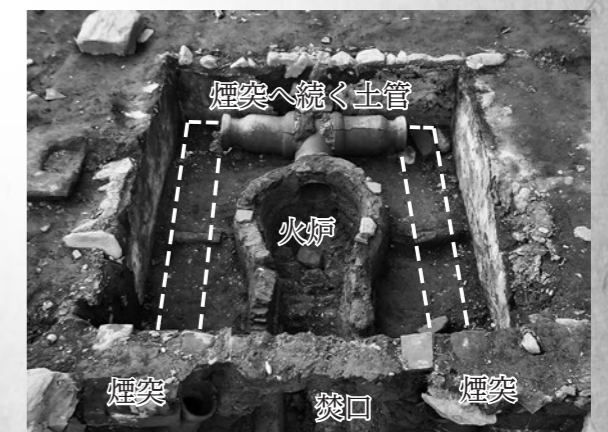
繭乾燥施設の跡と思われる遺構(破線は設置されていた土管の推定位置)

養蚕農家では、出荷用の繭の蛹を乾燥させる殺蛹を行っており、高山社の資料にも殺蛹する乾燥器の図が掲載されています。