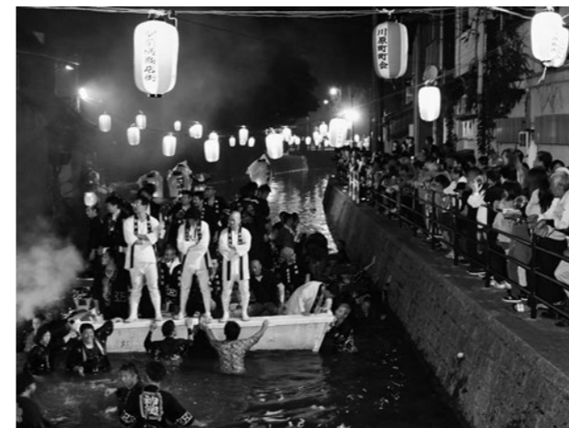
↑神輿を載せて長者川を往来し、観衆を沸かせる御座舟

9月から10月初旬ごろまで、市内の各町で順に開催される秋祭り。この川渡し神事はその中でも特に盛り上がりを見せる伝統行事になっています。