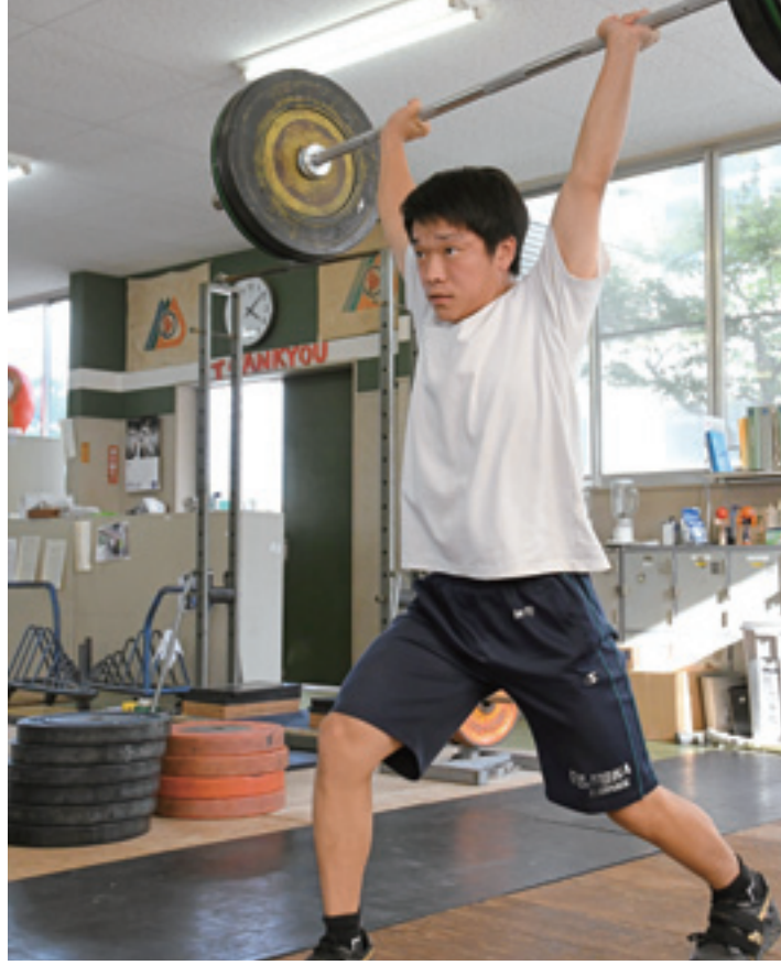
藤岡工業高校ウエイトリフティング部