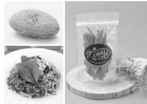
↑道の駅のと千里浜で販売されている「のとししカレーパン」(左上)、「のとししミート」(左下)、「のとししジャーキー」(右)