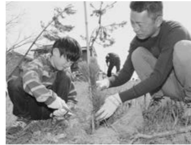
↑丁寧にクロマツの苗木を植える新1年生の親子