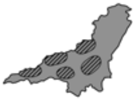
監視カメラ設置箇所

不法投棄事件を未然に防ぎ、ゴミが投棄された場合には警察へ情報提供を行い速やかに事件を解決するため、監視カメラを設置しました。このカメラで撮影された映像は、原則非公開とし、個人情報の保護には十分配慮した上で運用します。 設置箇所 日野・高山・三波川地区(下図のとおり)