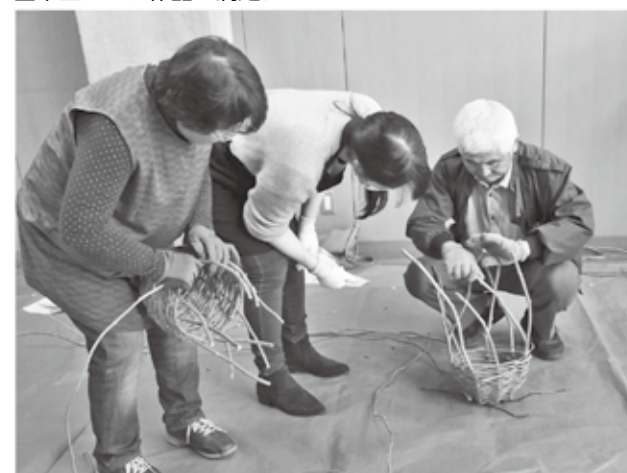
出来上がった作品に満足。

また、園内では1月31日(水)までイルミネーションの点灯を行っています。真っ暗な山あいに浮かび上がるイルミネーションが楽しめます。