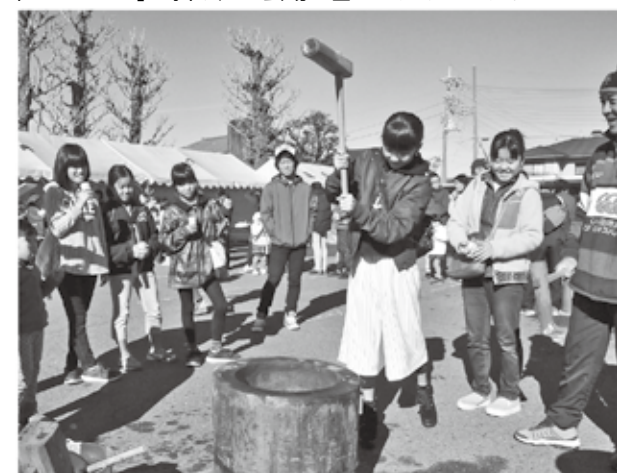
「ヨイショ！」の掛け声が会場に響きわたりました。

市内で就農や営農を希望する人、規模拡大や新規取り組みを開始したい人を対象に「就農・営農総合相談会」がJAたのふじ本店で開催されました。市担当者による就農のための制度説明や個別相談会の他に「農業の未来をみつめて」と題した講演会も行われました。