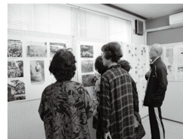
中には昔の友人の姿を見つけた人も。

藤岡公民館・藤岡中央児童館共催の「子どもまつり」が市民ホールで開催されました。会場には、餅つきやミニ電車の乗車、クリスマスリース作り、お手玉作り、パトカーの試乗などいろいろな体験コーナーが用意され、体験した子どもたちの笑い声が響いていました。