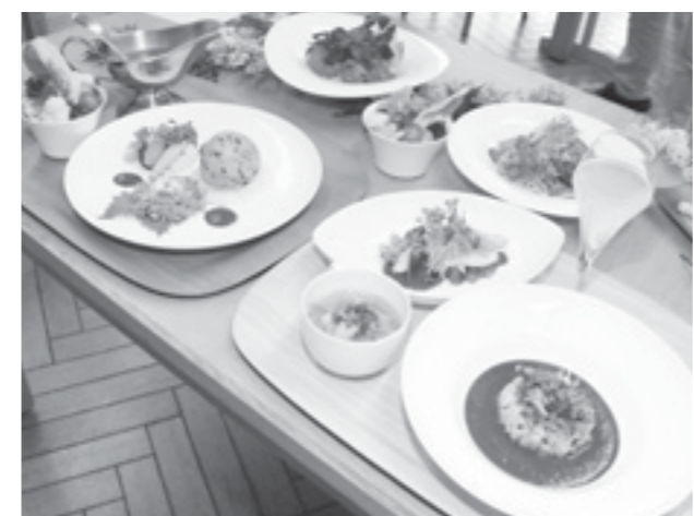
↑美しい盛り付けで料理が一層引き立ちます。