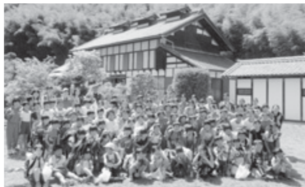
↑校区内にある世界文化遺産高山社跡をバックに全校生徒で遠足の思い出を作りました。