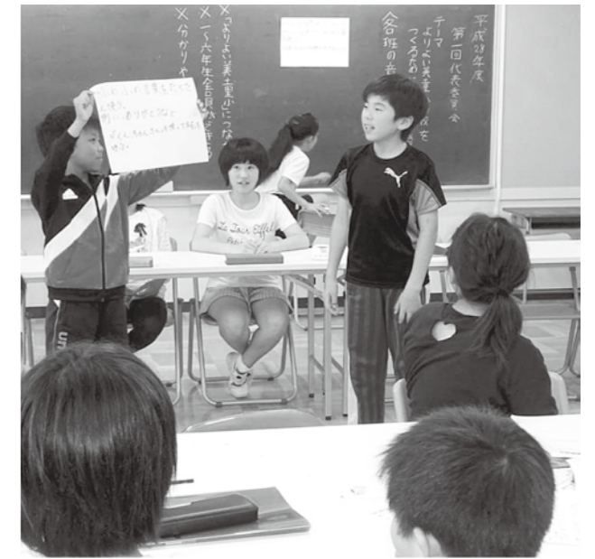
↑「よりよい美土里小をつくるにはどうしたらよいか」の話し合い。子どもたちが主体となって考えます。

子どもたちは友達に褒められることで「普段の何気ないことでも気付いてもらえ、認めてもらえる」と自分の行動に自信を持つことができます。そのことにより前向きな気持ちになり、「もっとたくさんの人によいところを伝えよう」と思いやりの輪が広がります。