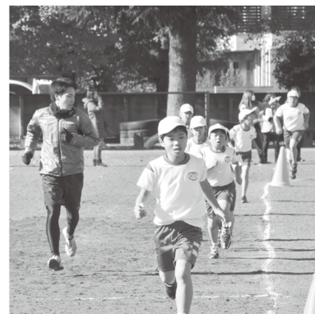
↑一緒に走る大学生や周りの人たちから応援が飛ぶ。つらい時の応援でいつも以上の力が出る。

化は保護者にも影響を与え、買い物など近場への移動には車を使わず、徒歩や自転車で行くことが増えました。これからも日々の小さな運動を積み重ね楽しく運動を続けていきます。