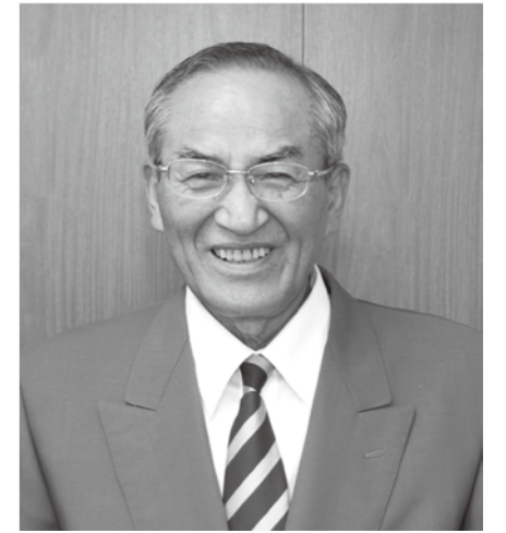
羽咋市長 山辺芳宣