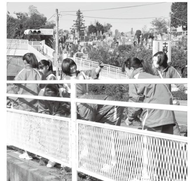
↑てきぱきと作業する保護者を手本に生徒たちは率先して作業に取り組みます。

域の人たちが提供してくれた食材で作られる豚汁を食べるのが楽しみ。作業に一層力が入ります。