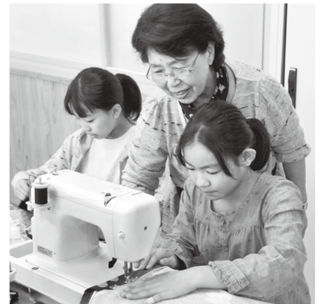
↑細かいところまで丁寧に教える地域のボランティアさんたち。毎回教えに来るのを楽しみにしていると話します。