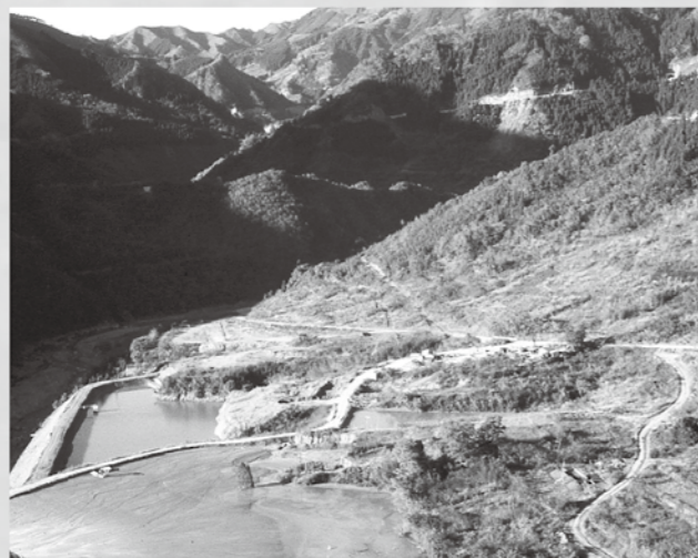
↑現在はダムの湖底に沈んでしまっている遺跡群。山間部でも見事な遺跡が発掘されています。