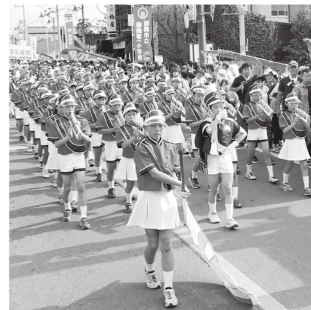
↑足並みと演奏をそろえて行進する子どもたち。心をつなげてパレードを先導します。

返ります。今まで感じたことのない緊張感。普段ではめったにできない体験をすることで子どもたちは大きく成長することができました。これからもほほえみ運動を通し、地域の中で学んでいきます。