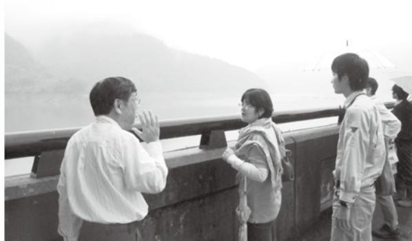
ダムの説明を受ける隊員。その魅力を探ります。

西毛地区の地域おこし協力隊は、定期的に情報交換会を開催しています。今回は初めて藤岡市で行われ、各地から訪れた隊員たちは、鬼石地区の観光資源やイベント、まちの雰囲気などに触れ、多くの魅力を感じ取ってくれたようでした。 中でも私を含めた皆に大きな印象を与えたのが下久保ダムでした。今まではダムについて深く考えることがありませんでしたが、生活用水を安定供給するだけ