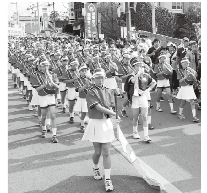
↑足並みと演奏をそろえて行進する子どもたち。心を一つにしてパレードを先導します。

返ります。今まで感じたことのない緊張感。普段ではめったにできない体験をすることで子どもたちは大きく成長することができました。これからもほほえみ運動を通し、地域の中で学んでいきます。