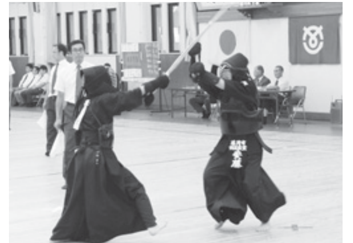
↑熱戦を繰り広げる両市の選手たち。会場は熱気に包まれました。

9月25日の姉妹都市提携30周年の記念式典に向けて、子どもたちが先陣を切り、両市の雰囲気盛り上げていました。