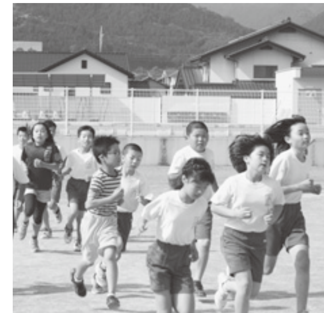
↑速さは人それぞれ、自分のペースで走ります。遅くても速くてもお互いに声を掛け合います。