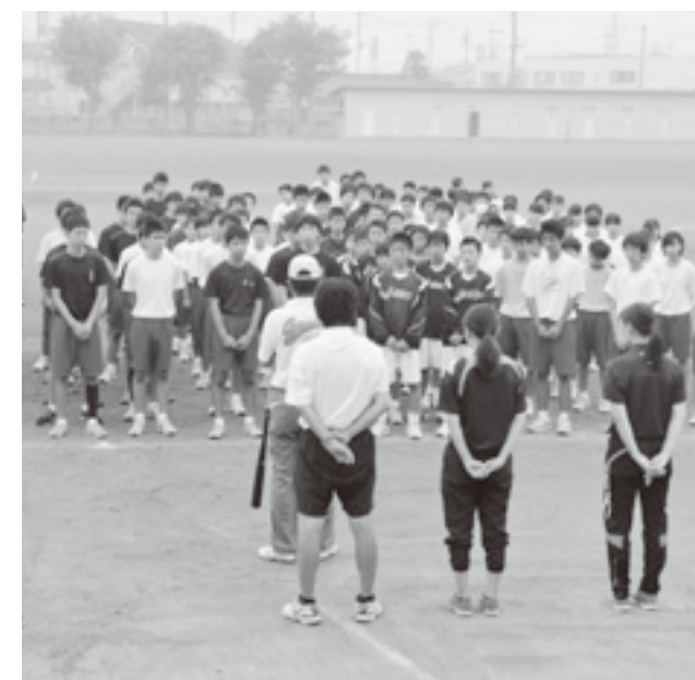
↑走る前に先生の話聞く子どもたち。厳しい言葉もありますが、子どもたちは真剣に耳を傾けます。

感じています。そんなやる気あふれる子どもたちのお手本となるべく先生自身も気を引き締めます。子どもたちはその背中を見て多くのものを学び取り、さらなる成長へとつなげていきます。