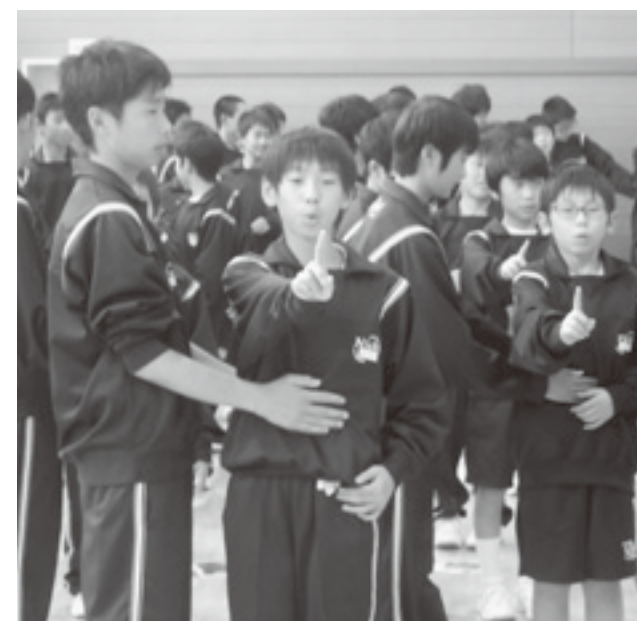
↑新入生のおなかを触り、腹式呼吸の確認。しっかりとできると吐いた息が指まで届く。

り、音を選んだりさまざまな工夫が見られました。歌える曲をたくさん増やし、つらいことがあってもその曲を口ずさんで元気を出す。そんな明るい集団を目指してこれからも歌い続けます。