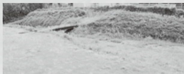
上：城門付近のイメージ図 下：現在の内堀跡の様子