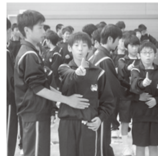
↑新入生のおなかを触り、腹式呼吸の確認。しっかりできると吐いた息が指まで届く。